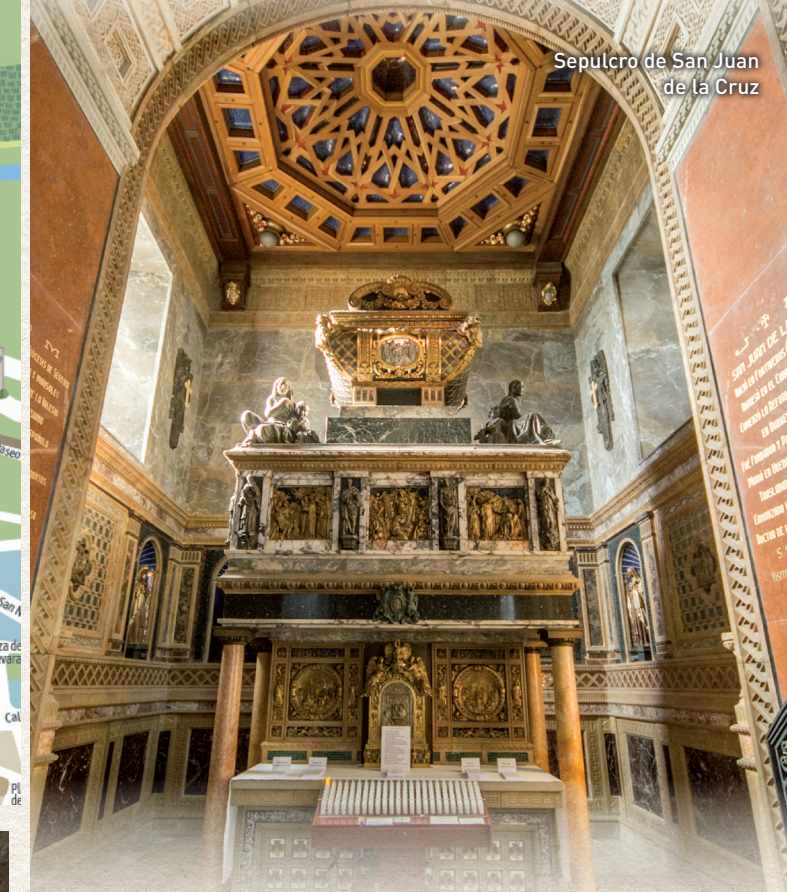
Sepulcro de San Juan de la Cruz

Final de la ruta y lugar fundamental en la vida de San Juan de la Cruz. Aquí vivió sus últimos años, ejerció su cátedra al aire libre y reposan sus restos . La serenidad del convento y del valle contribuyó a inspirar algunos de los textos más importantes de la mística universal.