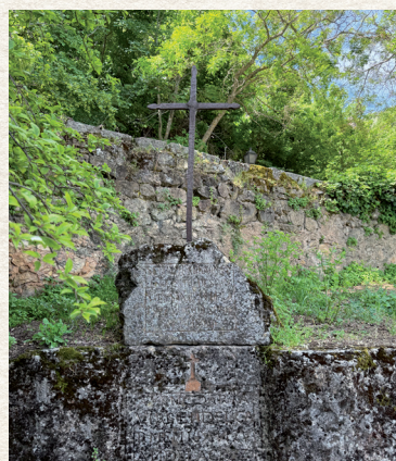
Lugar de descanso de San Juan de la Cruz en las inmediaciones del Jardín de los Poetas

Obra del escultor José María García Moro, situada en el descenso hacia el valle del Eresma. La imagen recuerda la estrecha relación del santo con este entorno natural y espiritual.